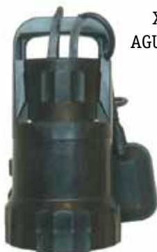
XKS 250 P AGUAS LIMPIAS

Electrobomba sumergible para evacuación de aguas grises o fecales. Con cuerpo de bomba e impulsor de plástico. Incorporan asa de transporte e interruptor de nivel.