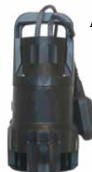
XKS 400 PW AGUAS SUCIAS